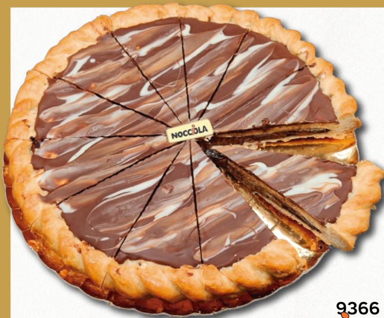
9366 PASTEL NOCCOLA PORCIONADO Típica especialidad local elaborada con hojaldre y crema de cacao, decorada con crema de cacao y avellana. 8 cajas por base 168 cajas por palé