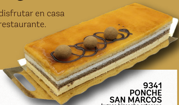
9341 PONCHE SAN MARCOS Jugoso bizcocho artesano emborrachado de anís, bizcocho de cacao, relleno con nata y crema con yema tostada. 7-8 porciones 2x800 g. 8 cajas por base 144 cajas por palé