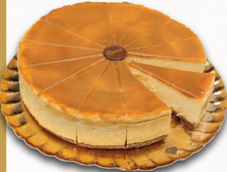
9059 TARTA QUESO CON DULCE DE LECHE PORCIONADA Exquisita masa de queso extracremoso con pasta brisa y dulce de leche. 14 porciones 2500 g. Ø26 cm. 8 cajas por base 120 cajas por palé