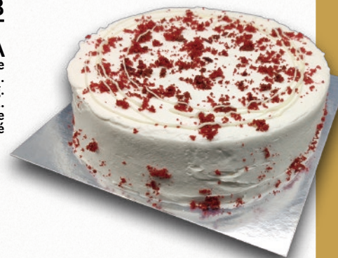
9328 TARTA RED VELVET BENJAMINA Bizcocho terciopelo y relleno de crema de queso. 8-9 porciones 900 g. ø22 cm. 12 cajas por base 144 cajas por palé