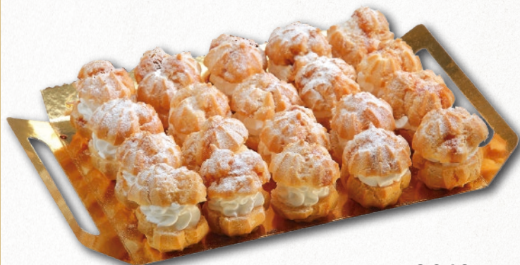
9016 BOCADITOS DE NATA 2 bandejas de 20 unidades. Peso aproximado 2x450 g. 8 cajas por base 168 cajas por palé