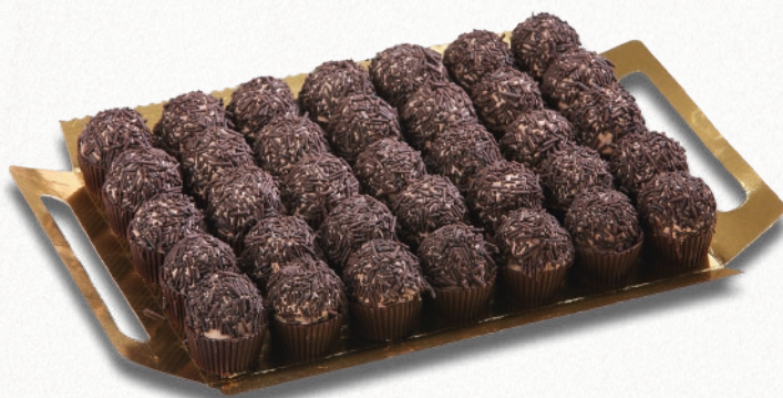
9024 TRUFITAS 2 bandejas de 35 unidades. Peso aproximado 2x750 g. 8 cajas por base 168 cajas por palé