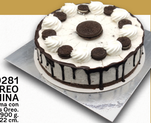
9281 TARTA CON GALLETA OREO BENJAMINA Exquisito mousse de crema con auténticas galletas Oreo. 8-9 porciones 900 g. ø22 cm. 12 cajas por base 144 cajas por palé