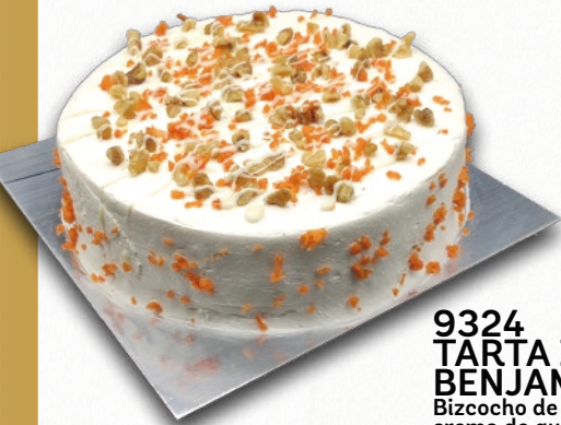
9324 TARTA ZANAHORIA BENJAMINA Bizcocho de zanahoria y cereales, crema de queso y nueces. 8-9 porciones 900 g. ø22 cm. 12 cajas por base 144 cajas por palé