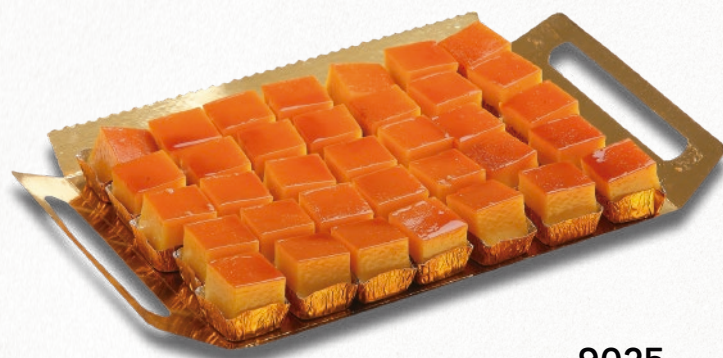
9025 MINITOCINILLOS DE CIELO 2 bandejas de 35 unidades. Peso aproximado 2x800 g. 8 cajas por base 168 cajas por palé