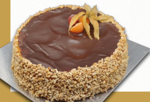
9203 TARTA CHOCO-YEMA SIN GLUTEN Y SIN LACTOSA BENJAMINA Bizcocho de harina de maíz, crema de yema de huevo y recubrimiento de glaseado de chocolate sin lactosa y granillo de almendra. 8-9 porciones 900 g. ø22 cm. Con harina sin gluten y leche sin lactosa. 12 cajas por base 144 cajas por palé