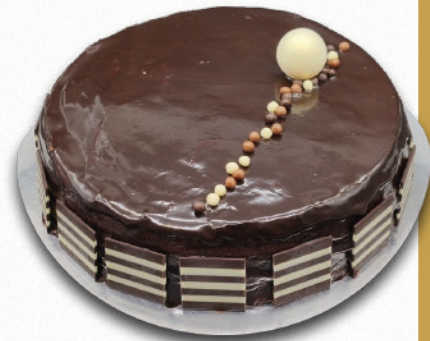
9188 TARTA MONCHER BENJAMINA Bizcocho de chocolate, crema de chocolate, crujiente Rocher y glaseado de chocolate. 8-9 porciones 950 g. ø22 cm. 12 cajas por base 144 cajas por palé