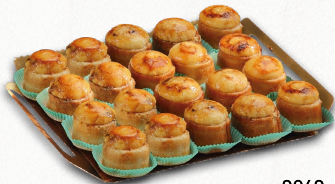
9049 MINIPIONONOS 2 bandejas de 20 unidades. Peso aproximado 2x800 g. 8 cajas por base 168 cajas por palé