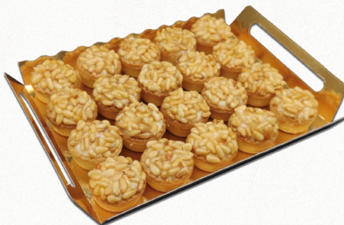
9030 MINITARTALETAS DE PIÑONES 2 bandejas de 20 unidades. Peso aproximado 2x750 g. 8 cajas por base 168 cajas por palé