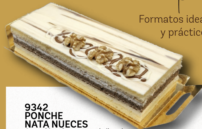
9342 PONCHE NATA NUECES Jugoso bizcocho artesano almidonado y bizcocho de cacao, relleno con mousse de nata, mousse de nueces y mousse de chocolate blanco. 7-8 porciones 2x800 g. 8 cajas por base 144 cajas por palé

Formatos ideal para disfrutar en casa y práctico en el restaurante.