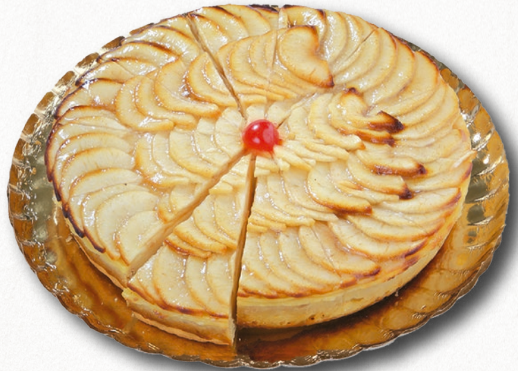
9055 TARTA DE MANZANA PORCIONADA Pasta brisa rellena de crema y manzanas seleccionadas. 12 porciones 1700 g. Ø28 cm. 8 cajas por base 168 cajas por palé