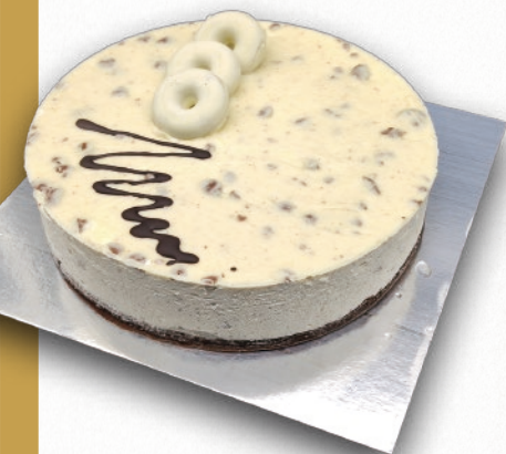
9323 TARTA FILIPINOS BENJAMINA Suave mousse de chocolate blanco con Filipinos, decorada con auténticos Filipinos. 8-9 porciones 800 g. ø22 cm. 12 cajas por base 144 cajas por palé