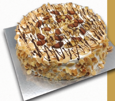
9202 TARTA SARA SIN AZÚCARES AÑADIDOS BENJAMINA Bizcocho sin azúcar y recubrimiento de glaseado de chocolate sin lactosa y frutos secos. 8-9 porciones 900 g. ø22 cm. 12 cajas por base 144 cajas por palé