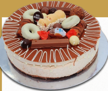
9280 TARTA KINDER BENJAMINA Delicioso mousse de crema de avellana y chocolate con leche, sobre esponjosa base de bizcocho de chocolate, decorado con surtido de crujientes chocolatinas. 8-9 porciones 900 g. ø22 cm. 12 cajas por base 144 cajas por palé

Formatos de 8-9 porciones para disfrutar en casa, en cualquier momento.